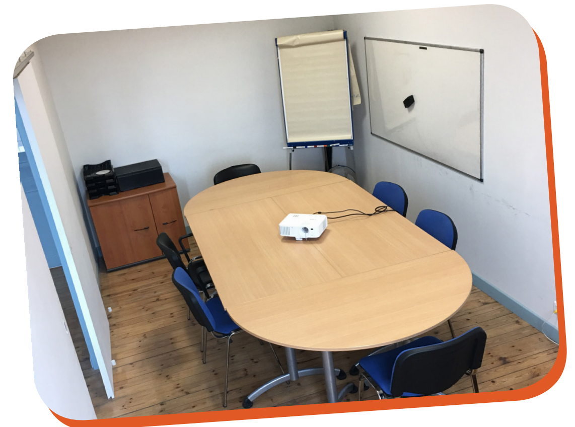
La salle de réunion