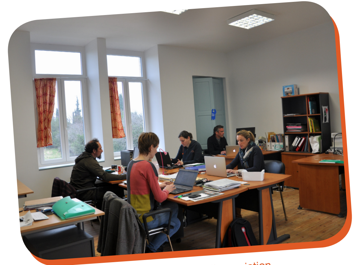
Les bureaux avec les adhérents de l'association