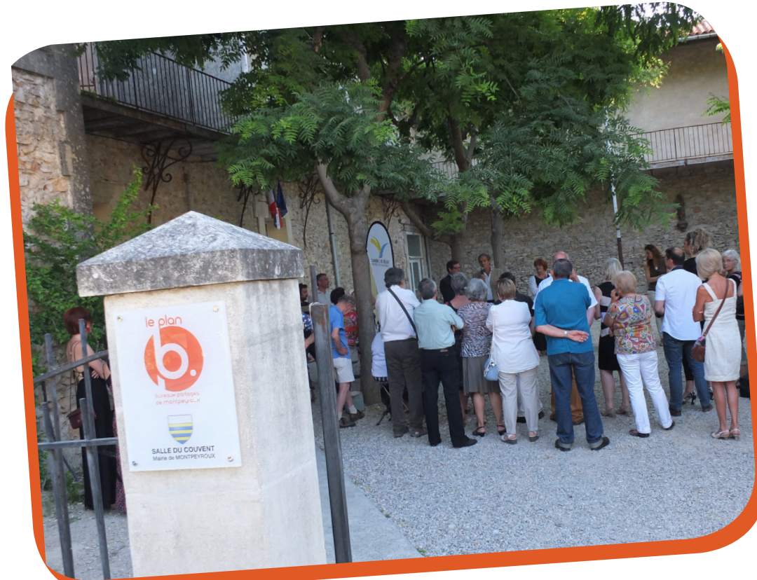
L'inauguration du Plan B en juin 2015