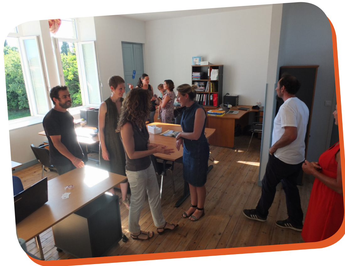
Journée portes ouvertes